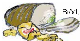
Bröd, kex och kakor