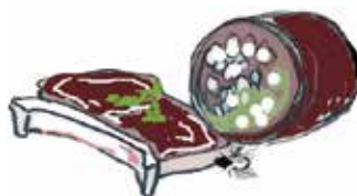
Kött och köttrens (ej större än att det får plats i papperspåsen)