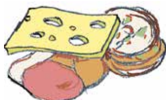
Ost och pålägg