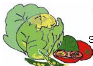
Skal och rester från grönsaker